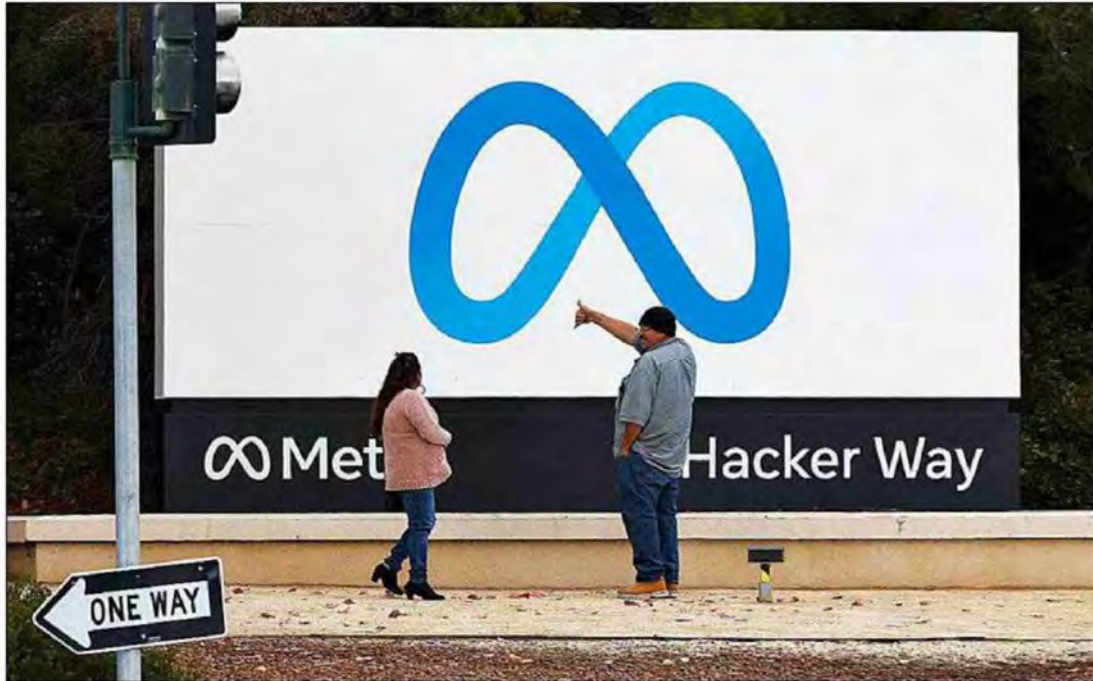
AÚN MÁS DESPIDOS EN META. Meta, que a finales de 2022 anunció un recorte de 11.000 empleos, prepara una nueva ronda de despidos, según el Financial Times. Los presupuestos internos se están retrasando por ello, dice.