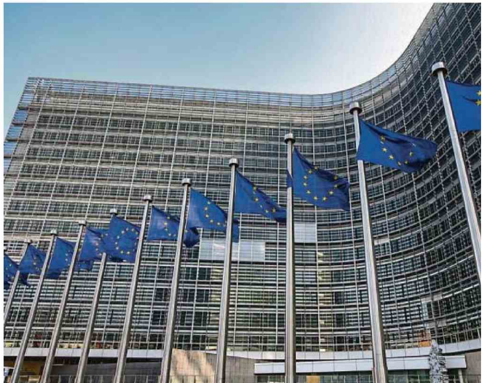
Au total, ce nouveau fonds de fonds devrait atteindre 10 milliards d'euros

Deux opérations ont déjà été bouclées, dont une avec un grand fonds français.